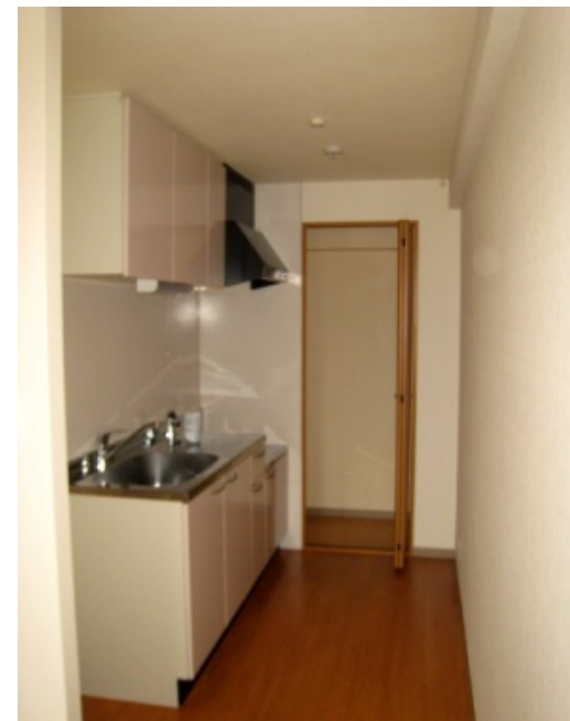
キッチンの奥にはパントリー （※写真は反転タイプです）