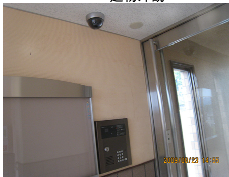
BGMが流れるエントランス